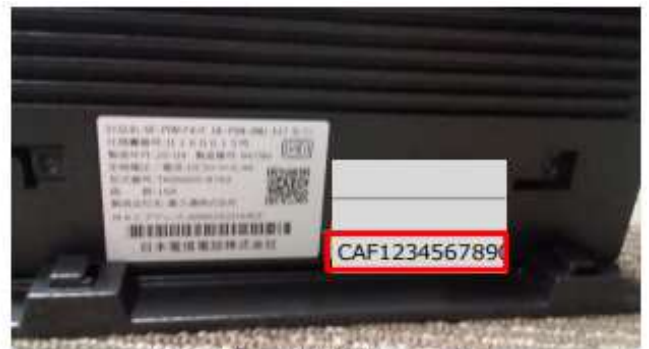
お客様IDが記載されています。

※ 重要 お客様の院内環境によっては、複数のNTT回線を契約し、ONUも複数台設置されている場合がございます。オンライン資格確認の利用申請を行う場合には、レセコンで使用しているONUのお客様IDをご使用ください。