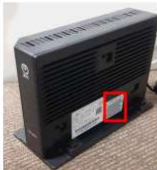
側面に貼付されている シール